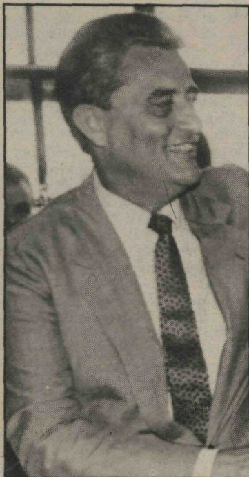
Governador Joaquim Roriz

A manhã, os moradores do Lago Sul apresentarão suas reivindicações prioritárias ao governador Joaquim Roriz e equipe administrativa, encerrando a programação, no Plano Piloto, do governo itinerante. O encontro, que também contará com a presença do cardeal arcebispo de Brasília, Dom José Freire Falcão, será no Seminário Arquidiocesano Nossa Senhora de Fátima - QI 19 - às 14h30. A revogação do dispositivo legal que instituiu o Projeto URB 18/84, ensejando expansão comercial, industrial, da rede hospitalar e educacional no Lago Sul, encabeça a lista de solicitações ao governador.