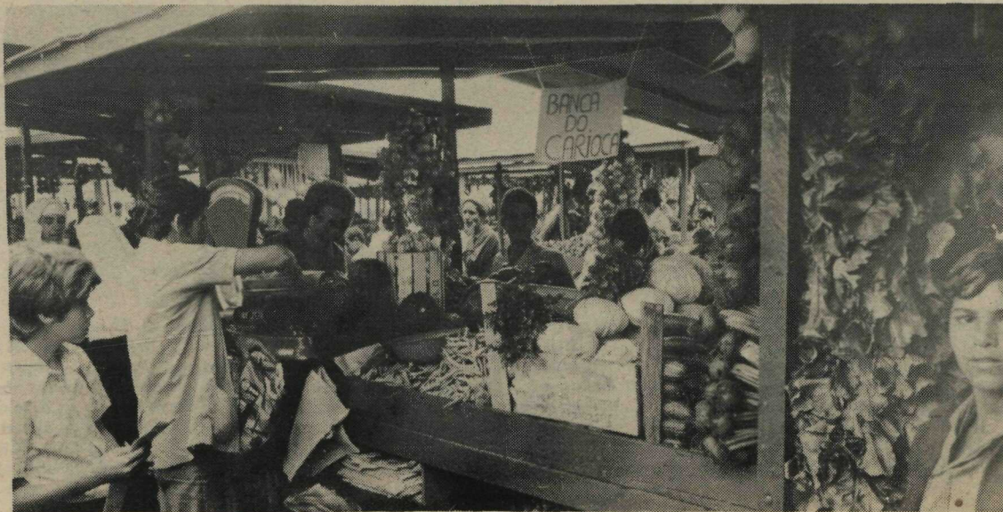
Barraca de verduras na nova feira-livre do Núcleo Bandeirante

Na cidade-satélite do Gama, a feira-livre do Gaminha contará com 20 bancas para doces, 30 para frutas, 10 para pescado, 7 para ovos, 12 para aves, 110 para produtos hortigranjeiros, 5 para artesanato e 5 para comércio de flores.