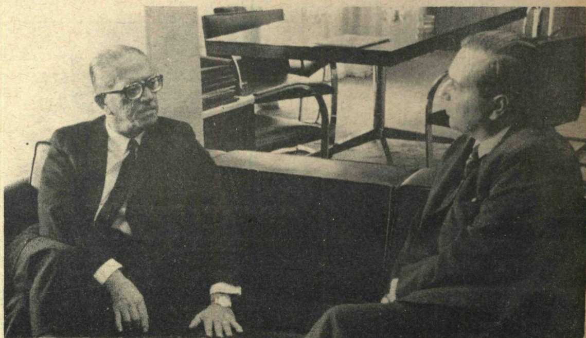
MINISTRO DA JUSTIÇA VISITA O GDF - O Ministro da Justiça, Professor Alfredo Buzaid, esteve no Palácio do Buriti, para uma visita de cortesia ao Governador Hélio Prates da Silveira. Na oportunidade, o Ministro Buzaid agradeceu sua inclusão na Ordem do Mérito Brasília, agraciado que foi pelo Governo do Distrito Federal, recentemente, com a Grã-Cruz daquela Ordem.

- A BOA CONSERVAÇÃO DOS BENS PÚBLICOS TRAZ BENEFÍCIOS PARA VOCÊ UTILIZE-OS CONVENIENTEMENTE.