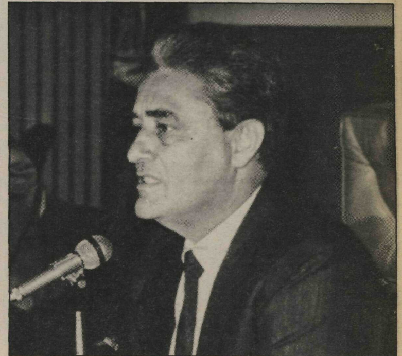
O governador do Distrito Federal