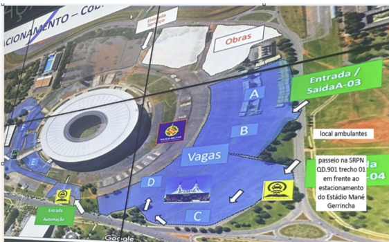
Área 01 Local de Licenciamento – SRPN Qd.901 trecho 01 – Asa Norte/DF. (20 vagas barraca e 20 vagas de caixeiro)