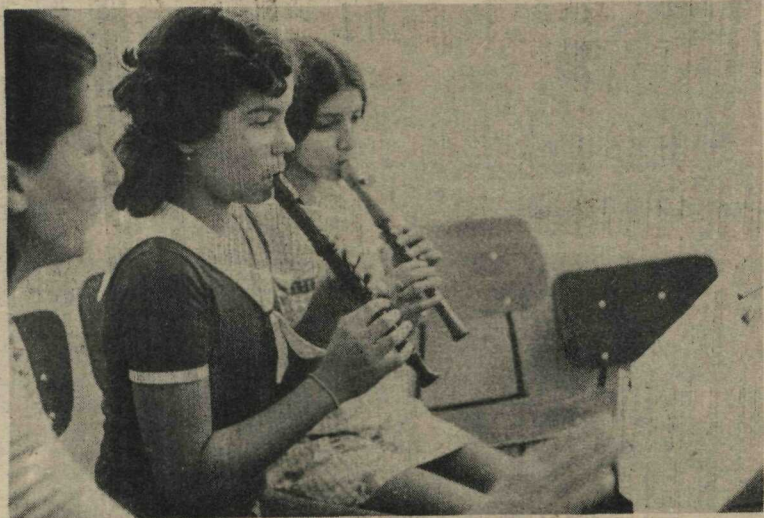
Alunas da EMB durante aula prática, sob a supervisão de professora

ta duração e seminários, para atualização, reciclagem e aperfeiçoamento dos professores da rede oficial do DF.