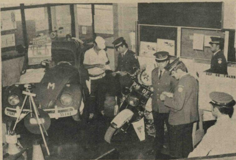
Uma completa exposição sobre trânsito está montada no "hall" do Detran