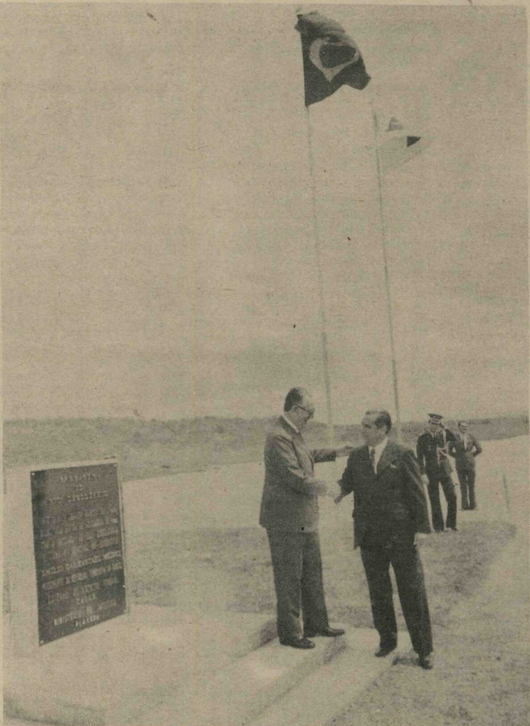
Após inaugurar a Barragem do Descoberto, o Presidente Emílio Médici cumprimenta o Governador Hélio Prates da Silveira pela execução da importante obra

A Barragem do Rio Descoberto, construída com recursos do FUNDEF, pela Administração Hélio Prates da Silveira, custou Cr$ 22 milhões. Está situada na divisa do Distrito Federal com o Estado de Goiás, distante 42 quilômetros do Plano Piloto e 25 de Taguatinga, através do asfalto da futura rodovia Brasília-Cuiabá. Um maciço de 54 mil metros cúbicos de concreto, com 265 metros de largura e 33 de altura, já começou a barrar as águas do rio, iniciando a formação do terceiro lago de Brasília. As águas inundarão uma área de 17 quilômetros quadrados e tornarão balneária uma das mais antigas cidades-satélites: Brasília. Quando estiverem na cota máxima, as águas ficarão 34 metros acima do Lago Paranoá e 1034 acima do nível do mar. Serão 120 milhões de metros cúbicos, que permitirão uma vazão de 518 milhões de litros por dia, capazes de abastecer uma população de um milhão e 200 mil pessoas.