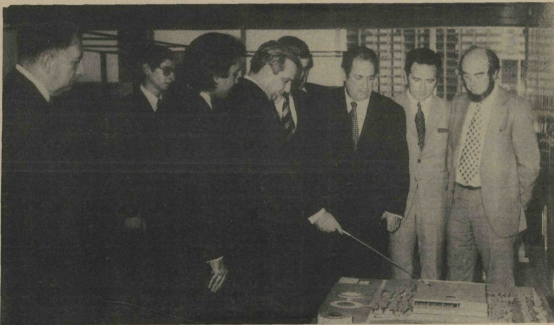
O governador Hélio Prates da Silveira mostra aos parlamentares franceses obras do GDF. Através de gráficos, mostrou a evolução de Brasília em cada setor

Uma delegação integrada por seis deputados franceses, incumbida de estudar e pesquisar os problemas sociais, educacionais, habitacionais e culturais no Brasil, esteve em visita ao Governador Hélio Prates da Silveira. O encontro teve lugar no Salão Nobre do Palácio do Buriti.