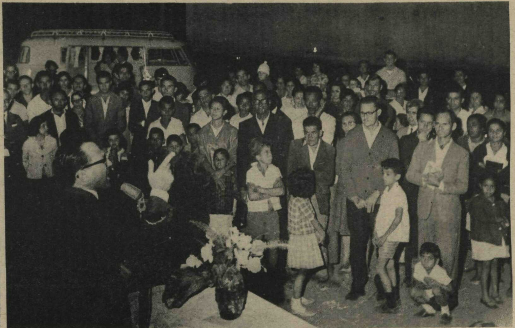
CONFERENCIAS RELIGIOSAS - Terá continuidade hoje, amanhã e depois de amanhã às 20 horas, na Igreja Presbiteriana Independente do Cruzeiro no Setor Residencial Econômico Sul, ciclo de conferências religiosas que vem sendo proferidas pelo conhecido evangelista Gerson Barbosa de Menezes (foto).

Criada no dia 19 de setembro de 1956, pela Lei 2874, tem desempenhado a NOVACAP, nesses 13 anos de ininterruptas atividades, um papel de vanguarda na edificação da cidade-modélo planejada por Lúcio Costa. A urbanização de todo o Plano-Piloto, da maior praça do mundo, a dos Três Poderes, num tempo recorde, tudo isso se deve a sua ação eficiente, em todos os setores de atividade.