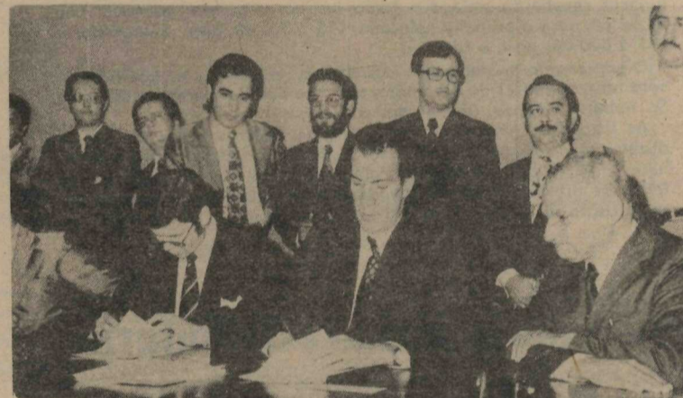
Ato de assinatura de contrato entre a CEB e a Telefunken, para aquisição de novos equipamentos

O equipamento, cujo valor total de implantação é da ordem de Cr$ 14.500.000,00, é fabricado de acordo com as técnicas mais avançadas, sendo dotado de um computador central que informa ao operador todas as ocorrências no sistema de distribuição de energia elétrica, dando alarmas, indicando defeitos, registrando situações indevidas, etc. O técnico operador, de posse dessas informações, estará capacitado a tomar decisões rápidas e precisas, por intermédio do painel supervisor, operando através de telemedição, telecontrole e telecomando. As decisões, bem como todas as ocorrências que as motivaram, serão automaticamente registradas por teleimpressoras,