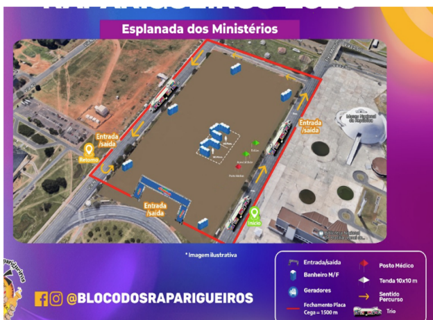
LOCAL LICENCIAMENTO DO BLOCO RAPARIGUEIROS – 15 BARRACAS

13.1. Não haverá reserva de vagas no chamamento público para as associações representativas da categoria dos Ambulantes.