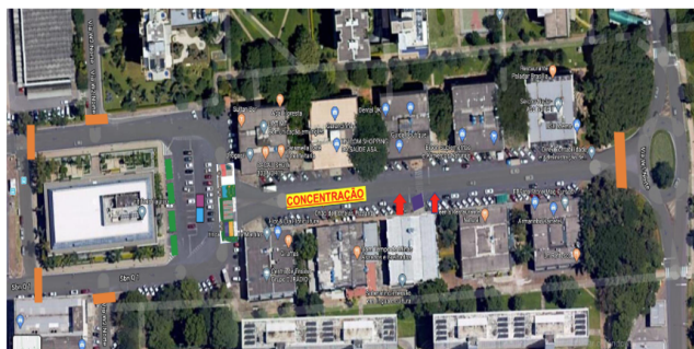
LOCAL LICENCIAMENTO DO BLOCO PACOTÃO – CAIXEIROS (30) – CONCENTRAÇÃO 302 NORTE ATÉ W3 SUL.