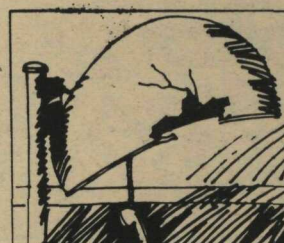
Ajude a conservar os "orelhões".