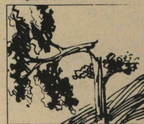
Não arrebente as árvores.