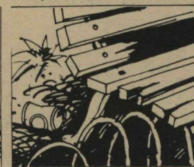
Não destrua as praças.