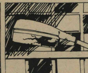
Não deprede a iluminação pública.