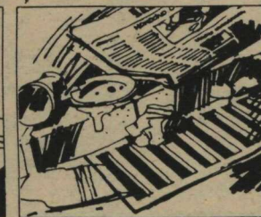
Não jogue detritos nos bueiros.