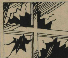
Não quebre vidraças de locais públicos.