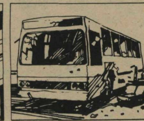
Ajude a conservar os meios de transporte.