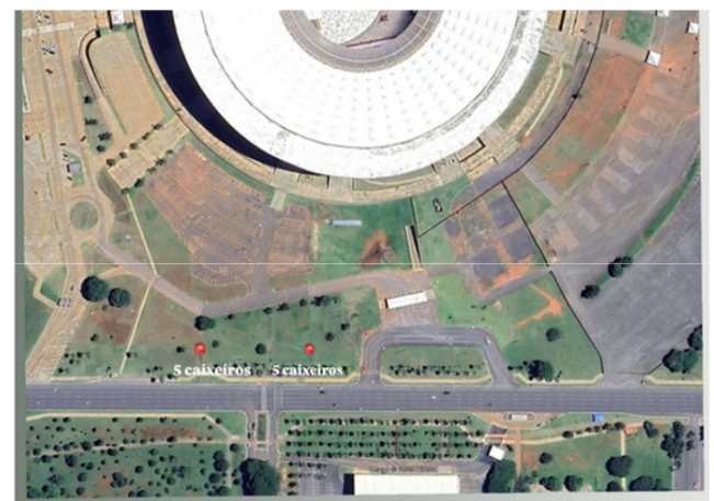
Área 03, 20 vagas de caixeiro na calçada do Estádio Mané Garrincha, SRPN - Asa Norte/DF.