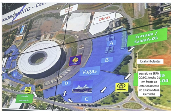
Local de Licenciamento – SRPN Qd.901 trecho 01 – Asa Norte/DF. (20 vagas).