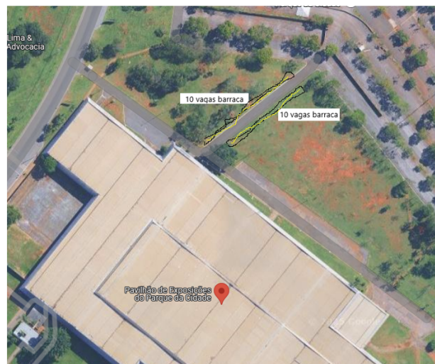
PISTA DE ACESSO DO ESTACIONAMENTO AO PAVILHÃO DO PARQUE DA CIDADE – 20 VAGAS DE BARRACA

13.1. Não haverá reserva de vagas no chamamento público para as associações representativas da categoria dos Ambulantes.