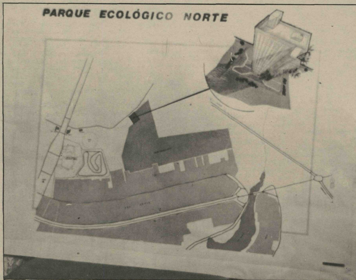
Projeto do Parque Ecológico Norte, uma ação governamental que visa a melhoria do meio ambiente

Conselho acompanhará a execução da política ambiental do DF