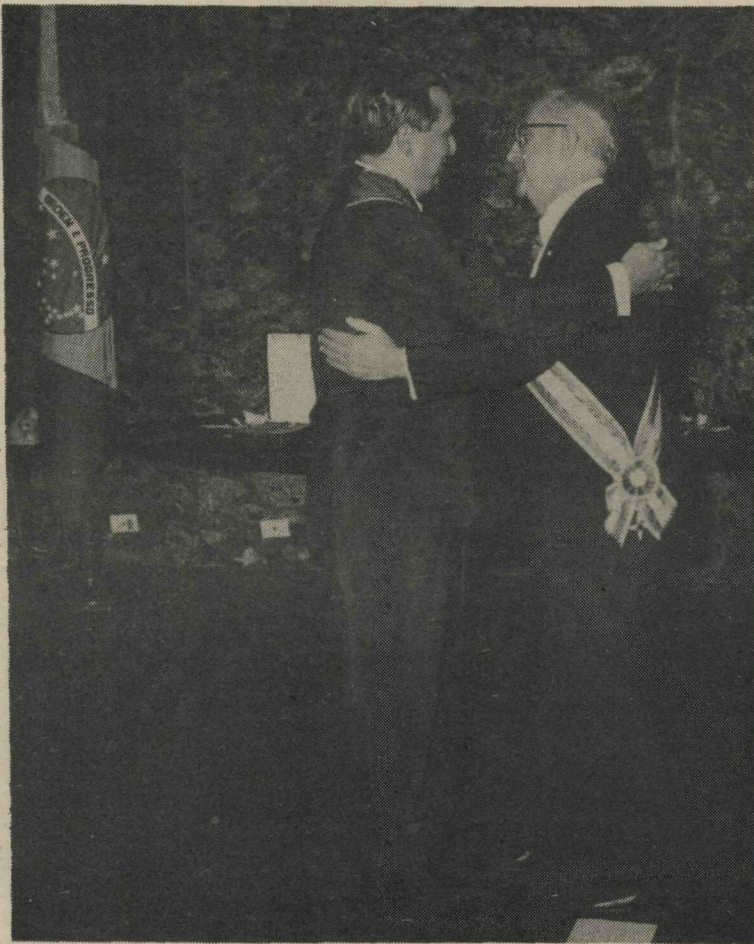
COLÔMBIA - BRASIL - O Governador do Distrito Federal, sr. Hélio Prates da Silveira, e o Sr. Leónidas Londoño y Londoño Embaixador da Colômbia junto ao Governo brasileiro, trocaram condecorações, no Gabinete do Chefe do Executivo do GDF. (Página 2)