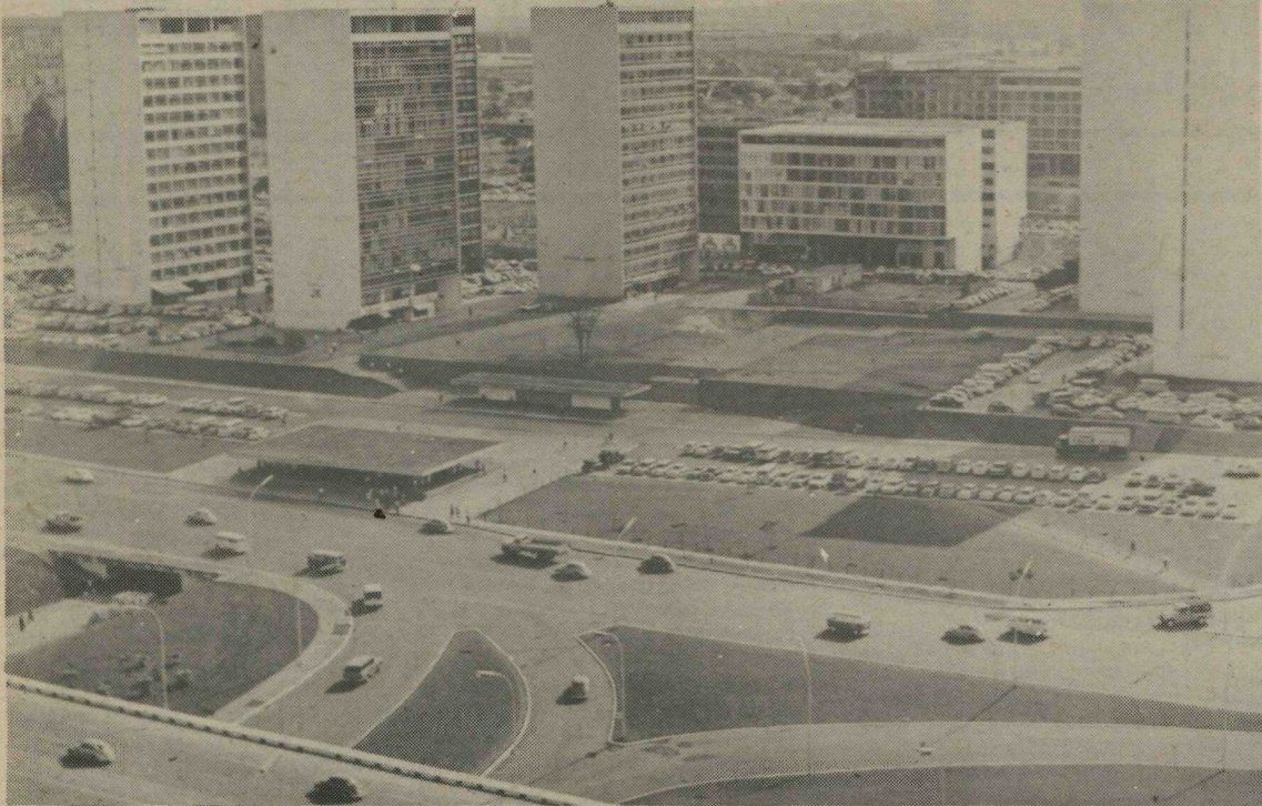
BRASÍLIA MONUMENTAL - O Setor Comercial Sul, um dos mais movimentados da Capital da República. Nesses edifícios estão instalados consultórios médicos e de odontologia, escritórios em geral, além de lojas de comércio fino e bares. Em primeiro plano, trevo de acesso aos Setores Bancário e Comercial, vendo-se ao centro a cobertura da passagem de nível ligando esses setores e onde a Secretaria de Serviços Públicos está preparando lojas para o pequeno comércio