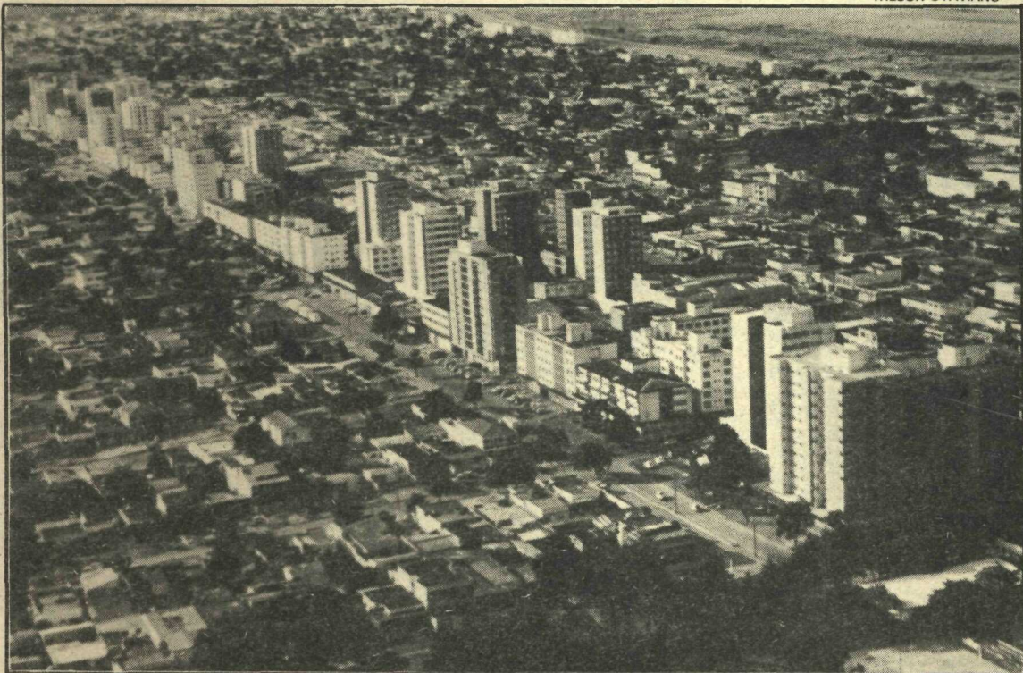
A cidade-satélite, com mais de 480 mil habitantes, recebe o governo itinerante e faz reivindicações