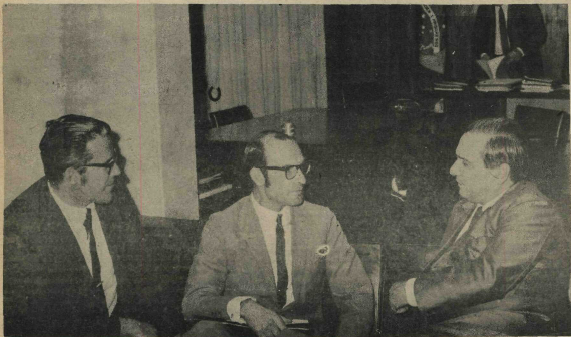
Diretores do Ginásio Brasília, do Núcleo Bandeirante, expõem ao Governador Hélio Prates da Silveira, os problemas do mais antigo estabelecimento de ensino do Distrito Federal, que serão solucionados com um convênio com o Governo

devido aos educandários oficiais não cobrarem taxas. A criação de um convênio colocaria o Ginásio à disposição do Governo, mediante uma remuneração equivalente às mensalidades pagas pelos alunos regulares. O Governador disse ao visitante que o problema já estava nas cogitações do Governo e que concretização do convênio é viável e deverá ser feita tão logo seja possível. O Professor Wathier se comprometeu a entregar um esquema de como poderia ser realizado o convênio, para que o assunto seja debatido.