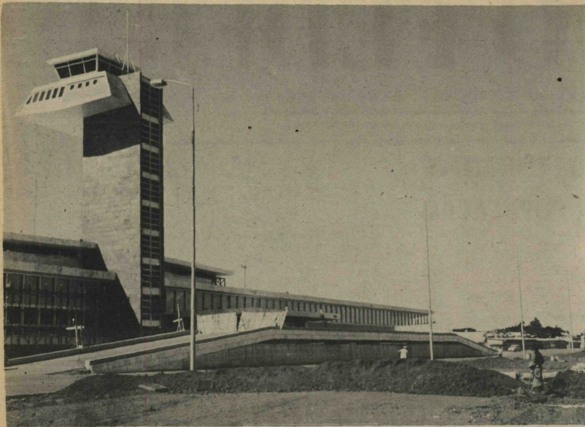
URBANIZAÇÃO DO NOVO AEROPORTO - Encontra-se em fase final, devendo estar concluída nos próximos quarenta dias, a urbanização da parte externa do Aeroporto Internacional de Brasília, segundo informações do Departamento de Viação e Obras da NOVACAP. Estão sendo executadas, no momento, a complementação do calçamento pré-moldado, colocação dos meios-fios e conclusão da pavimentação do contorno ao balão do Aeroporto e à saída da Cidade. A Companhia de Eletricidade de Brasília, por sua vez, já concluiu a instalação dos 25 postes de iluminação da área externa do Aeroporto, que têm 14 metros de altura, com lâmpadas a mercúrio de 400 watts. Os trabalhos de iluminação estarão concluídos na próxima semana, com a colocação dos transformadores