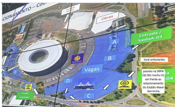
ÁREA 01 – 25 vagas na SRPN QD.901 trecho 01