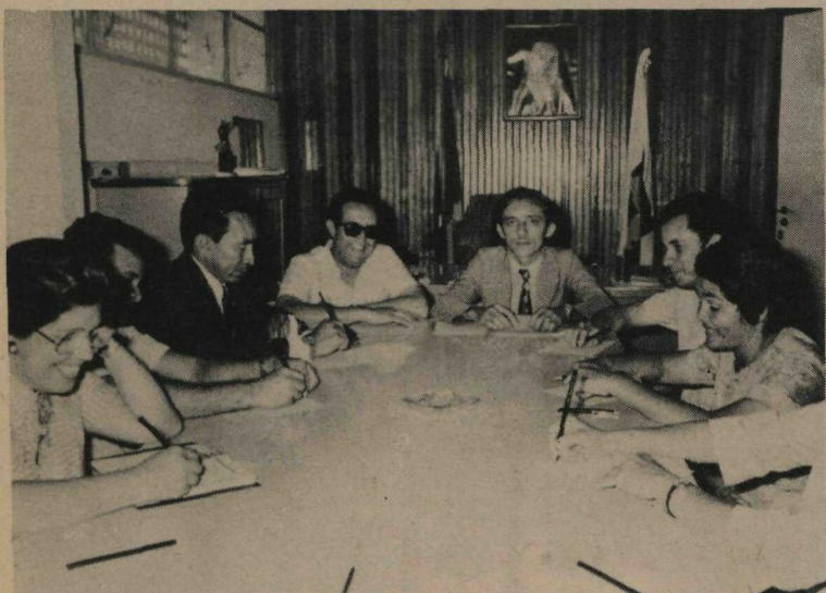
A Comissão de Festividades do 40º aniversário de Braslândia já está elaborando o programa a ser desenvolvido no dia 5 de junho