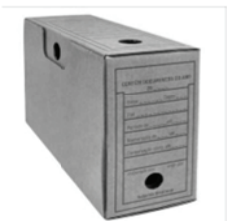
Arquivo morto (papelão) Composição: papelão com duas capas de Kraft; Dimensões: (350 mm X 140 mm X 250 mm)