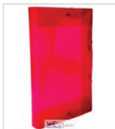
Pasta com aba (plástico) Composição: polipropileno polionda; Dimensões: (350mmX235mmX20mm)