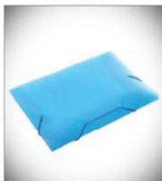
Pasta com aba (plástico) Composição: polipropileno polionda; Dimensões: (350 mm X 235 mm)