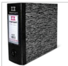
Registradores A/Z ofício Composição: papelão revestido interna e externamente com (plástico); Dimensões: (345mmX285mmX75 mm)