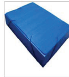
Pasta com aba (plástico) Composição: polipropileno polionda; Dimensões: (350 mm X 235 mm X 20mm)