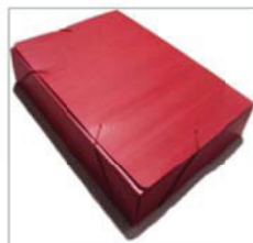
Pasta com aba (plástico) Composição: polipropileno polionda; Dimensões: (350mmX235mmX 55mm)