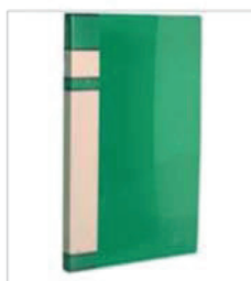
Pasta (plástico) com grampo mola Composição: cartão duplex Dimensões: ofício