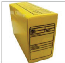
Arquivo morto (plástico) Composição: polipropileno polionda; Dimensões: (350 mm X 130mm X 245 mm)