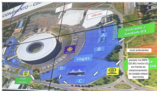
ÁREA 01 – 25 vagas na SRPN QD.901 trecho 01

13.1. Não haverá reserva de vagas no chamamento público para as associações representativas da categoria dos Ambulantes.