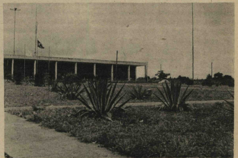
URBANIZAÇÃO DE PRAÇA - Localizada bem no Setor Central do Gama, a Praça da Administração Regional teve completada sua urbanização, com arborização e ajardinamento feitos pelo Departamento de Parques e Jardins da Novacap. Naquela logradouro público estão localizados, além da Administração Regional da cidade-satélite, Posto da Cotelb, Agência da CEB e da Caesb. Nas suas proximidades estão a 14ª Delegacia de Polícia, a sede do Centro de Desenvolvimento Social e a Agência do INPS.