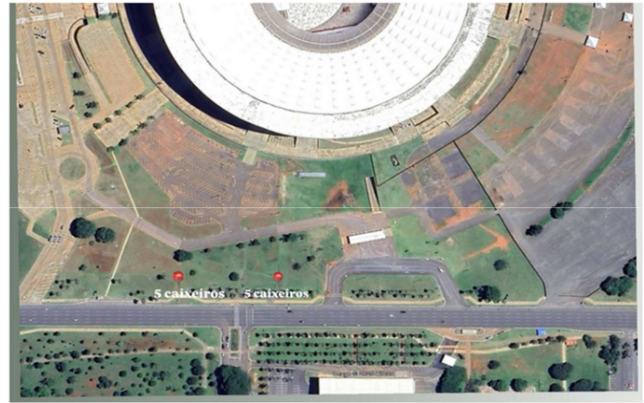
Área 03, 20 vagas de caixeiro no calçadão do Estádio Mané Garrincha, SRPN - Asa Norte/DF.

13.1. Não haverá reserva de vagas no chamamento público para as associações representativas da categoria dos Ambulantes.