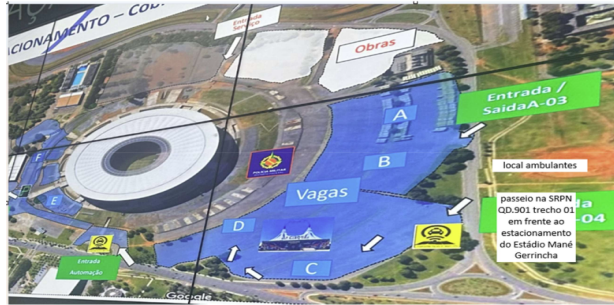
ÁREA 01 – 25 vagas na SRPN QD.901 trecho 01