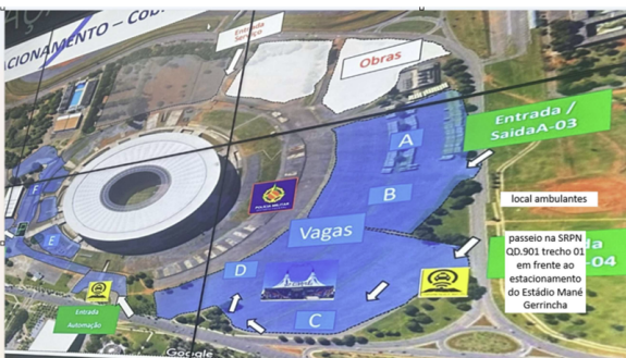
Área 01 Local de Licenciamento – SRPN Qd.901 trecho 01 – Asa Norte/DF. (20 vagas barraca e 20 vagas de caixeiro)