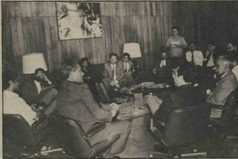
O governador anunciou que está elaborando uma nova proposta para regulamentação de áreas