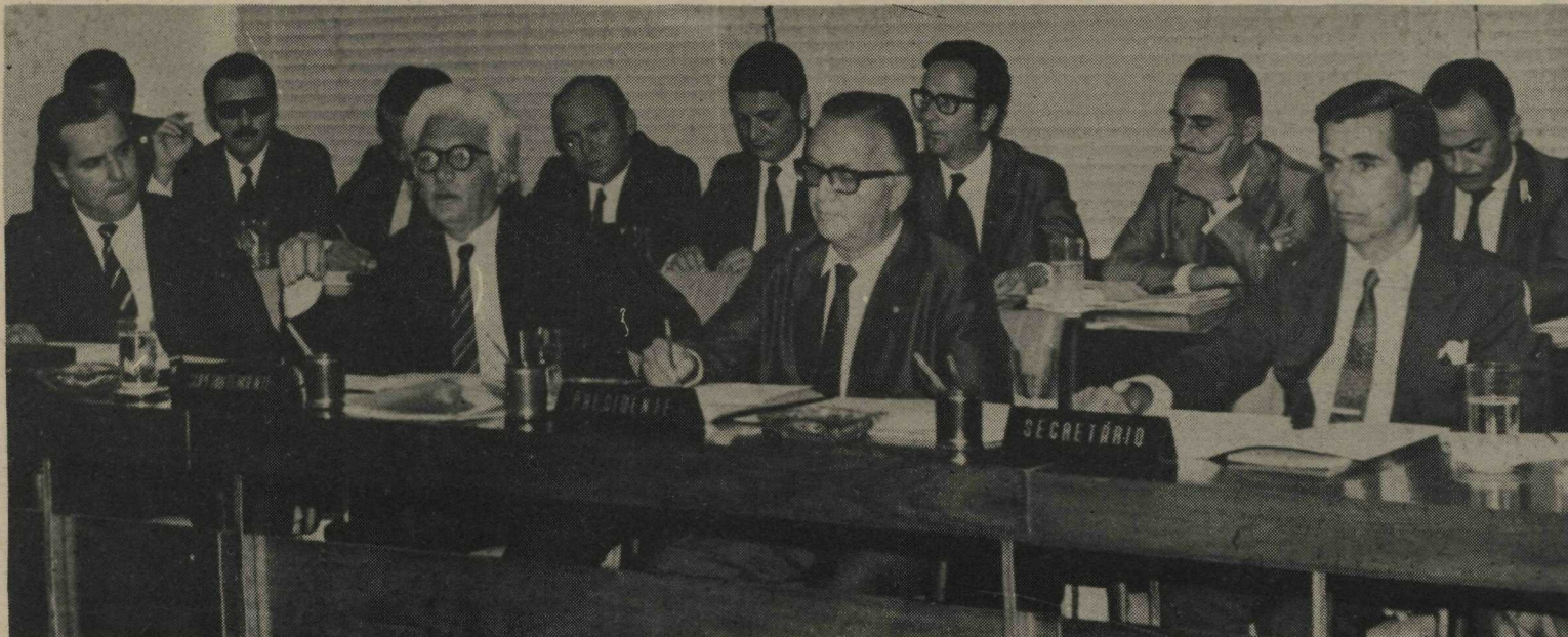
O Ministro Costa Cavalcanti, do Interior, presidiu a reunião do Conselho Deliberativo da SUDECO, ontem, nesta Capital. Durante o encontro, o Engenheiro Camargo Júnior, Superintendente do órgão (na foto, entre o Ministro e o Governador Hélio Prates da Silveira), fez uma exposição sobre as realizações da instituição

Todos os planos regionais terão de ajustar-se ao Plano Nacional de Desenvolvimento, que o Governo encaminhará em setembro ao Congresso Nacional. O Sistema antigo de cada órgão ter seu plano diretor próprio está ultrapassado, pois nem sempre seu período de execução coincide com o programa global do Governo ou seus objetivos.