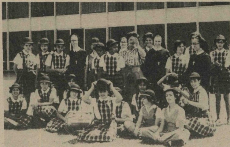
Um grupo de vinte e duas moças do Colégio "Santa Marcelina", de São Paulo esteve quarta-feira última em visita ao

Palácio do Buriti. As estudantes estão hospedadas no Anexo I do Brasília Palace Hotel, com a colaboração do Departamento de Turismo do DF e permanecerão em Brasília durante quatro dias.