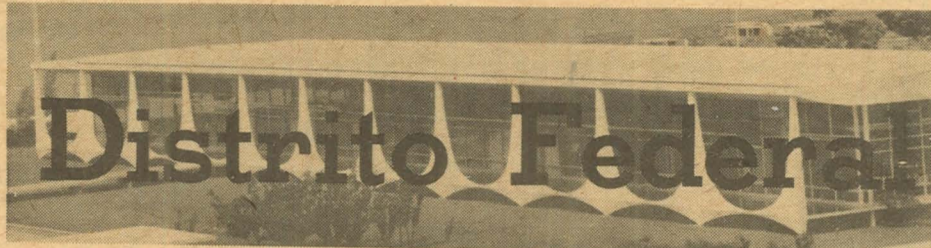
Brasília, 29 de dezembro de 1967

OFICIAL - Dólar, 2,715; libra, 6,570; franco, 0,555,53; lira, 0,0043,63; marco, 0,68217; escudo, nom.; peso argentino, 0,008063; peseta, nom.