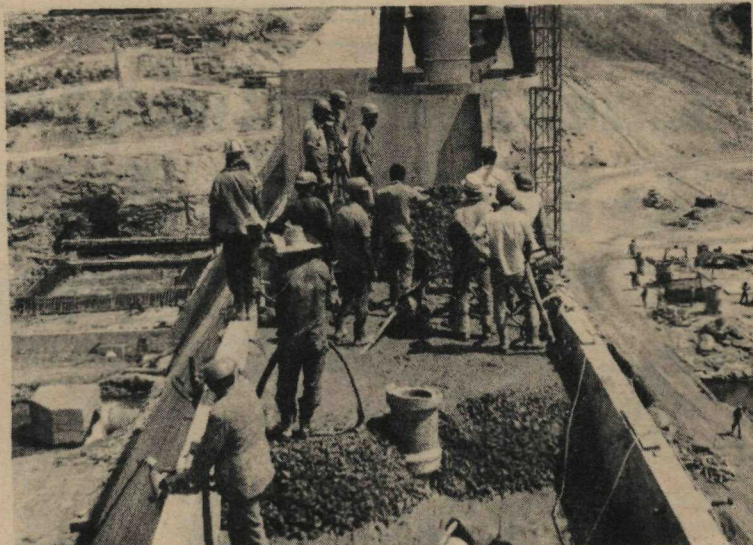
Operários trabalham em regime intensivo, terminando a concretagem

Segundo previsões dos engenheiros da CAESB, se ocorrer nesta estação chuvosa a mesma precipitação pluviométrica do ano passado, a Barragem do Descoberto atingirá a cota máxima de 1.032 dentro de quatro meses. O Rio Descoberto apresenta uma vazão de 7 mil litros por segundo, na seca, e 186 mil litros p/seg, no índice máximo. Depois de cheia, a Barragem acumulará 103 bilhões de litros de água.