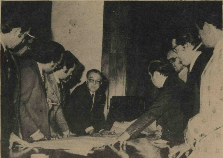
O Governador Elmo Serejo Farias prometendo um terminal ferroviário para cargas