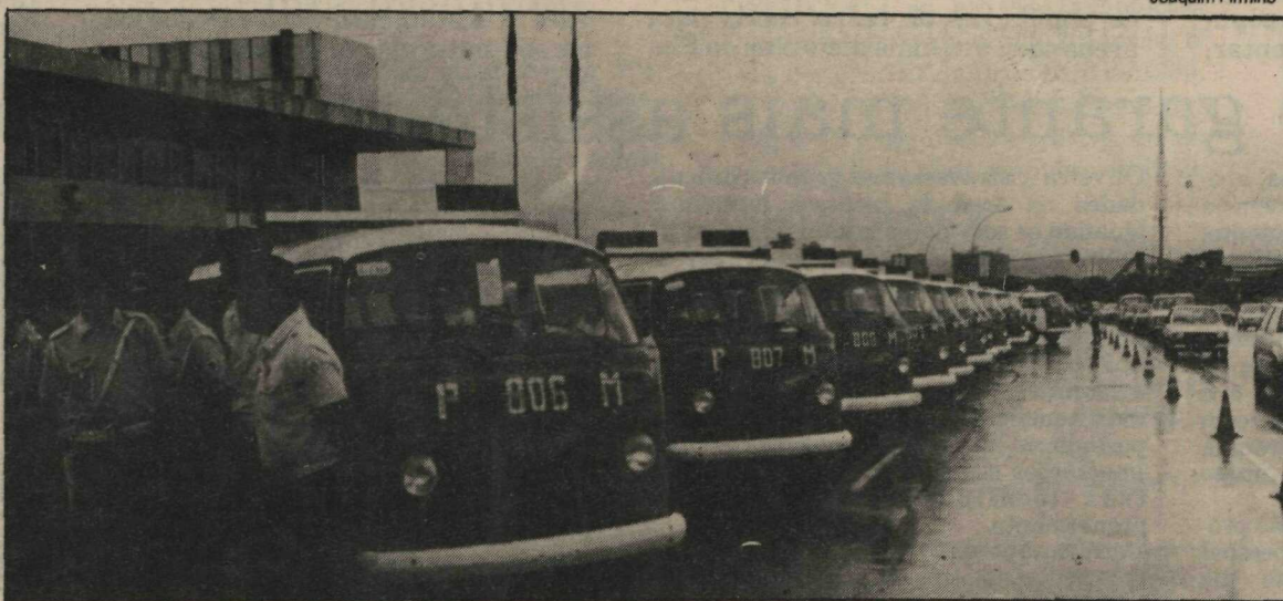
Este ano houve sucessivas incorporações de novas viaturas às frotas policiais

Para o reaparelhamento do Organismo de Segurança Pública, ainda dentro do plano de expansão, serão necessárias a construção de sete delegacias policiais da Segunda Coordenação de Polícia Especializada em Taguatinga; complementação do Edifício Sede da Polícia Civil; prosseguimento da remoção e ampliação da frota de veículos e equipamentos da Polícia Militar, renovação de alguns equipamentos e viaturas do Corpo de Bombeiros; e amplia-