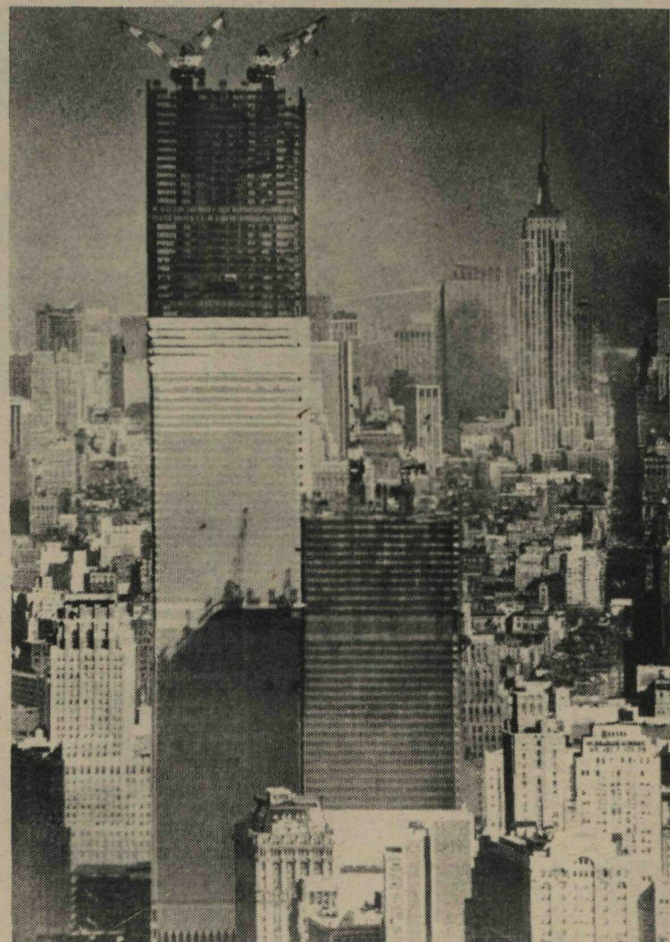
EMPIRE STATE JÁ NAO É O MAIS ALTO - Após vários anos de hegemonia, o majestoso Empire State Building, visto ao fundo, à direita, acaba de ceder sua posição de mais alto edifício do mundo para o World Trade Center Building, visto em primeiro plano, com os operários trabalhando já em sua 103a. laje. O nôvo gigante de Nova York terá duas torres gêmeas com 110 andares cada uma, medindo 405 metros de altura. O Empire State tem 102 andares e mede 375 metros

Lembrará um avião de "dois estágios", com um veículo orbital menor montado nas costas do primeiro estágio.