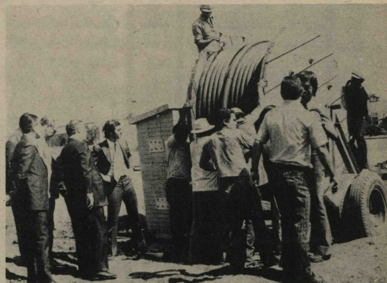
O Governador Hélio Prates da Silveira assistiu aos trabalhos de lançamento do cabo primário da estação da Central Telefônica-Norte

Da Central Norte a comitiva rumou para o Posto Telefônico da Avenida W-3/Sul, localizado na Quadra 508, onde estão sendo realizadas as obras de ampliação que possibilitarão o aumento de ca-