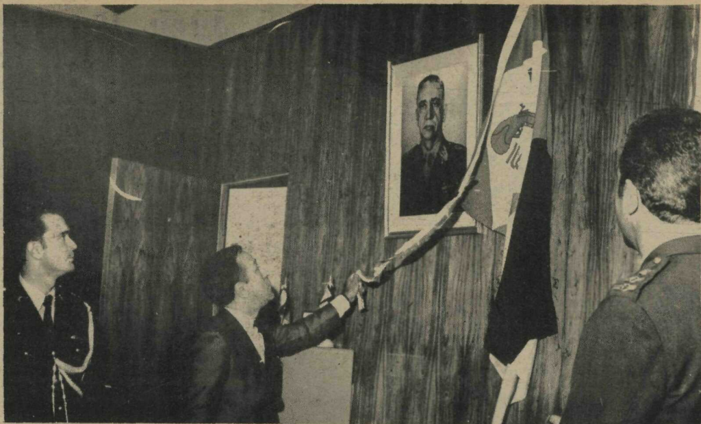
Aniversário da PM-DF - Durante as solenidades de comemoração do 160o. aniversário de fundação da Polícia Militar do Distrito Federal, inauguração do retrato do Coronel Meira Mattos, no Gabinete do Comandante da Corporação

O veículo deverá entrar em produção comercial no próximo ano.