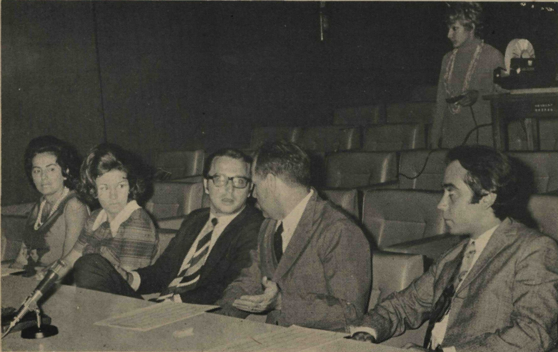
A Comissão Julgadora levou dois dias examinando os "slides" coloridos sobre Brasília, ao fim dos quais escolheu os melhores. E o DETUR enriqueceu o seu acervo de divulgação, a ele incorporando os 413 "slides" participantes

Teve a maior receptividade o Concurso de "Slides" coloridos sobre Brasília, promovido pelo Departamento de Turismo do Governo do Distrito Federal.