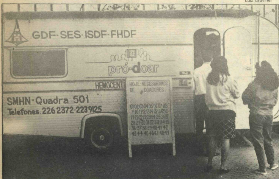
A Associação Brasileira de Doadores Voluntários recebeu cooperação dos funcionários

A campanha objetivou despertar a pessoa para o prazer de salvar vidas