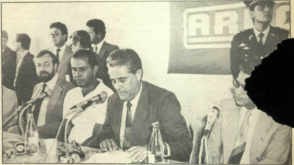
O governador já ouviu diversas vezes os moradores, inclusive na sede da Aruc

Quase mil casos de edificações irregulares no Cruzeiro entre construção de segundo pavimento fora do gabarito e implantação de grades, varandas, muros, terraços e garagens em áreas públicas, além de tantas outras infrações que vêm comprometendo o projeto de urbanização e pondo em risco a segurança de seus moradores, ensejam às lideranças comunitárias a apresentação de propostas ao governador Roriz. Como sugestão, será solicitada uma política global para os casos de obras já edificadas sobre as calçadas e liberação oficial do gabarito para segundo pavimento no Cruzeiro Velho.