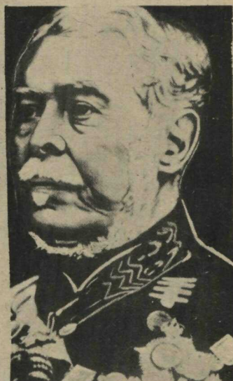
O Duque de Caxias

Comemorou-se ontem, 25 de agosto, o Dia do Soldado, data esta que perpetua a memória do nascimento de Luis Alves de Lima e Silva, o Duque de Caxias, Patrono do Exército Brasileiro.