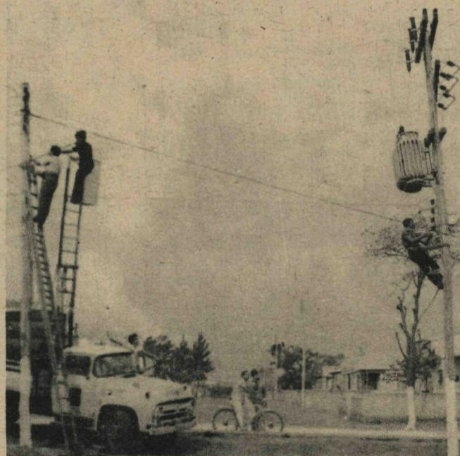
Rede elétrica está sendo aumentada em vinte e seis quilômetros. O serviço deverá estar concluído em março de 69. Quando os primeiros raios solares do dia 12 de outubro de 1960 desciam sobre Brasília, nascia um novo núcleo do Distrito Federal - a cidade-satélite do Gama.

Ao ser comemorado o seu 80. aniversário, está o Gama colocado em segundo lugar entre as cidades-satélites, do ponto de vista sócio-econômico, com 60 000 habitantes, distribuídos em 500 km 2 de área, dividida em quatro setores (norte, sul, leste e oeste); o que lhe garante a situação de ser a única cidade-satélite de Brasília totalmente planejada. Distante 35 km do Plano Piloto, esta situada entre córregos do Crispim e do Alagado e é servida pelas BR-7 e BR-14.