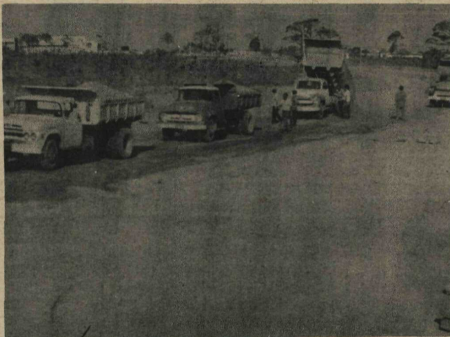
Caminhões do Departamento de Viação e Obras Públicas da PDF trabalhando no serviço de pavimentação do trecho que liga Setor Oeste ao Setor Leste.