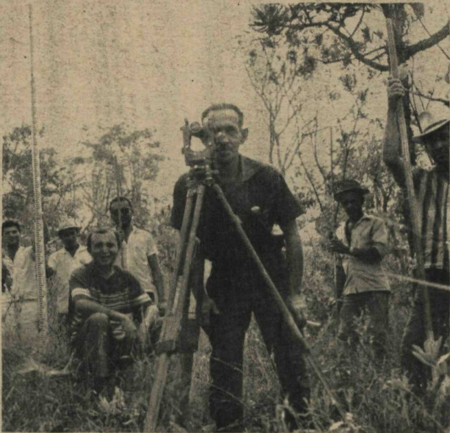
Equipe de topografia da Subprefeitura trabalhando no sentido de garantir a cidade o título de "inteiramente projetada".