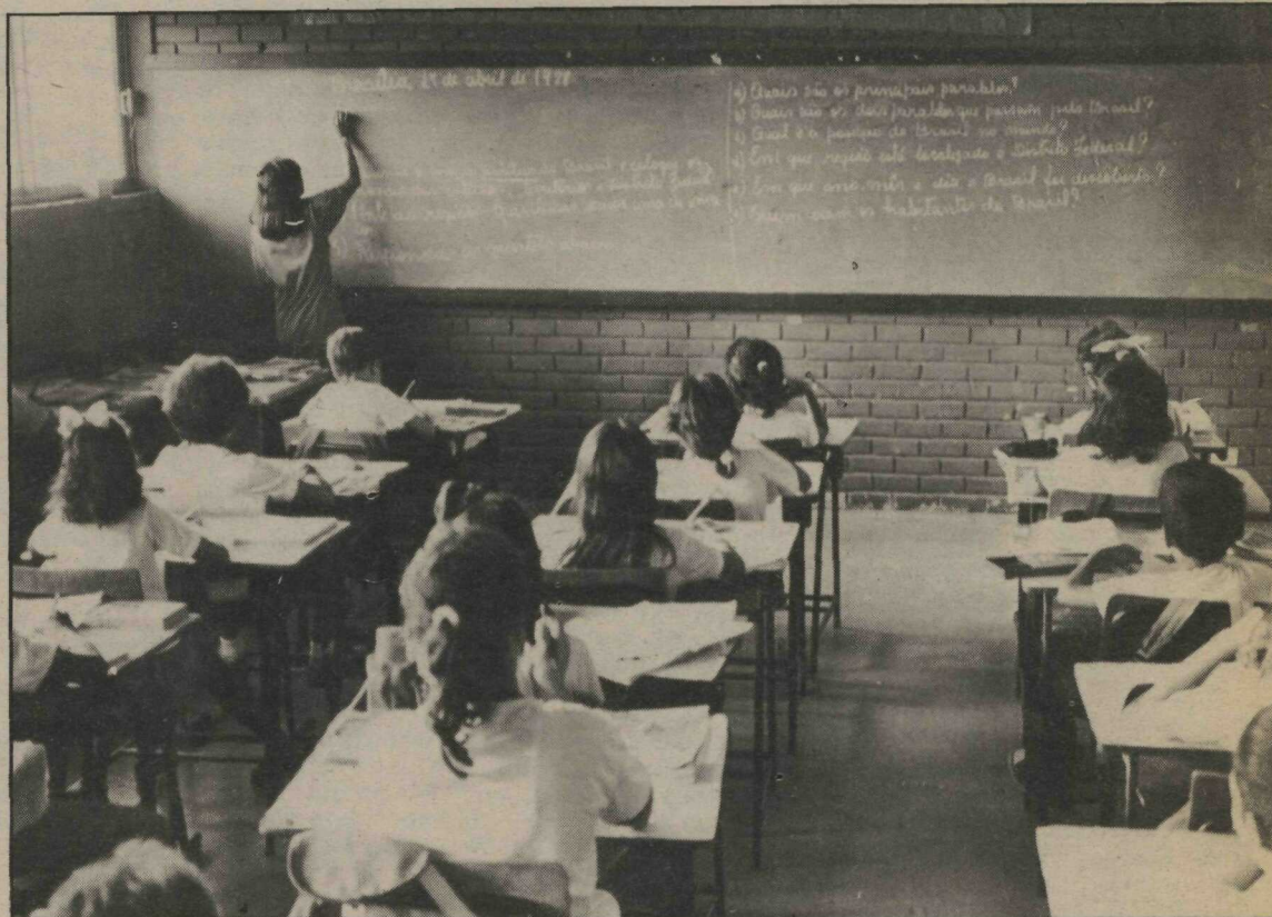
FEDF quer valorizar o ensino, através de visitas a escolas e maior assistência aos estudantes

Malva lembrou que as escolas vinculadas à FEDF também receberam melhorias em 89. O Proem, por exemplo, atende hoje 393 alunos carentes e conta com quinze microcomputadores para o curso de computação a 175 alunos.