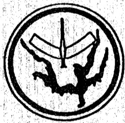
MESA DIRETORA E COMISSÕES TÉCNICAS