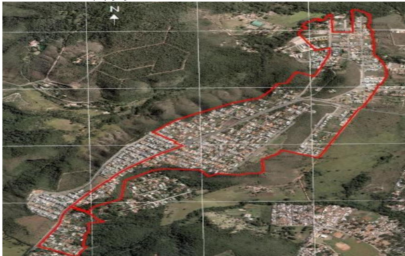
Imagem 1- Mapa de Localização – Condomínio Quintas do Sol Esboço da poligonal da área objeto da Reurb. Brasília/DF, 01 de julho de 2026

Esboço da poligonal georreferenciada do Núcleo Urbano Informal Condomínio Quintas do Sol (Sistema UTM/SIRGAS 2000).