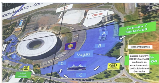
Área 01 Local de Licenciamento – SRPN Qd.501 trecho 01 – Asa Norte/DF. (20 vagas barraca e 15 vagas de caixeiro)