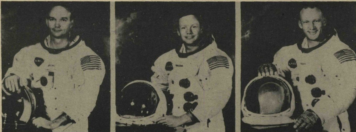
MICHAEL COLLINS NEIL ARMSTRONG EDWIN ALDRIN

A partir de agora, contemplando a grandiosidade dos espaços siderais, a criatura humana civilizada se penetrará melhor de seu gregarismo atávico. E viverá verdadeiramente a noção de humildade perante a magnitude da Criação.