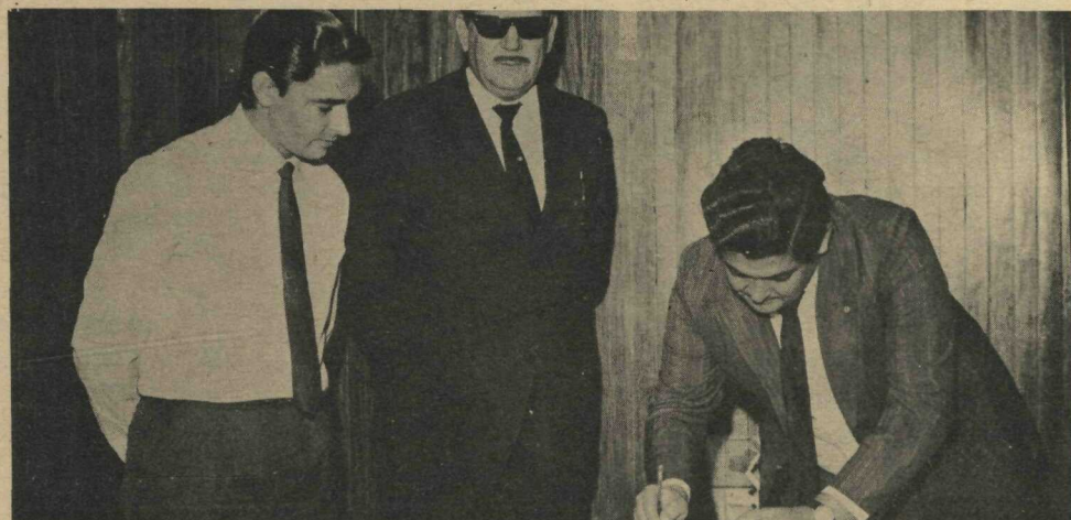
A Novacap assinou com a Construtora Elite S.A., um contrato de empreitada global para reconstrução da obra do Jardim de Infância da Superquadra 208 Sul.