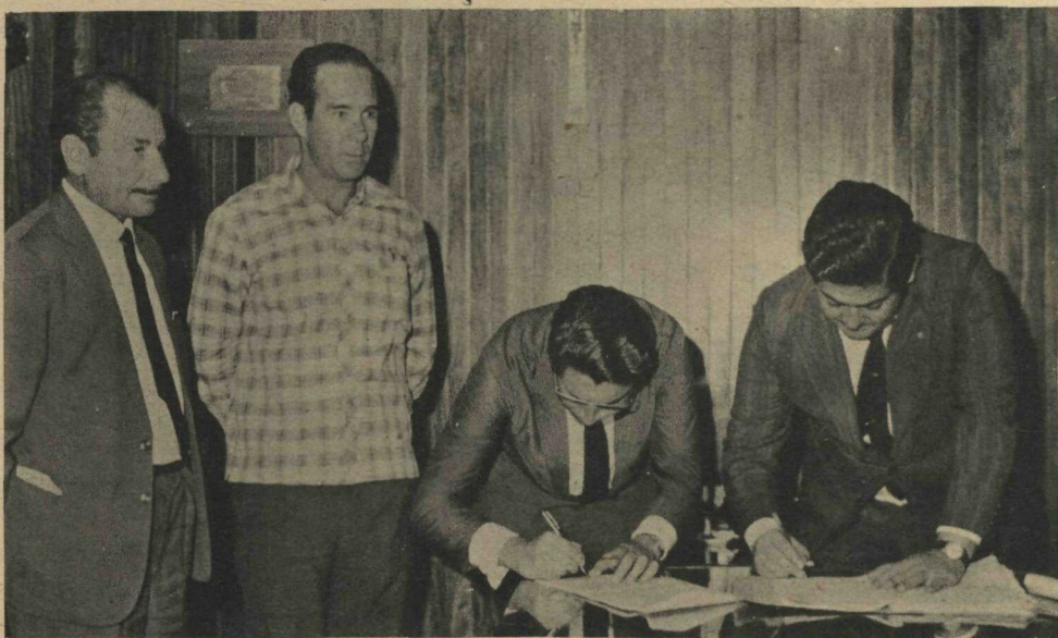
Ato da assinatura do contrato assinado entre a Novacap e a Cia. Construtora Pederneiras S.A. para sob o regime de Administração, dar acabamento no Anexo II da Câmara dos Deputados.