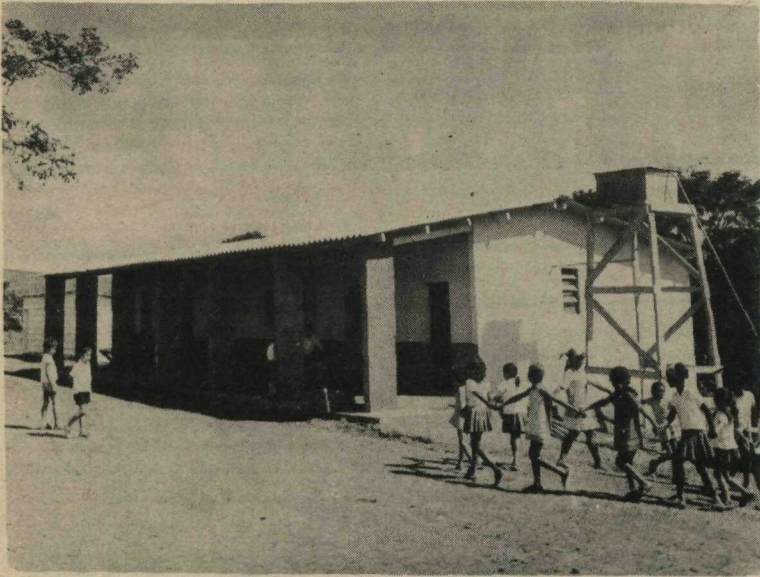
MAIS ESCOLAS RURAIS - Atualmente, 66 Escolas Rurais são mantidas pela Fundação Educacional, nas diversas áreas do Distrito Federal. Cerca de 4.500 crianças, na faixa de 6 a 15 anos, recebem o ensino primário. Dentro do programa estabelecido pela GDF para expansão dessa rede de ensino, a Fundação Educacional está concluindo mais 13 unidades escolares (R).