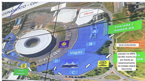
ÁREA 01 – 25 vagas na SRPN QD.901 trecho 01