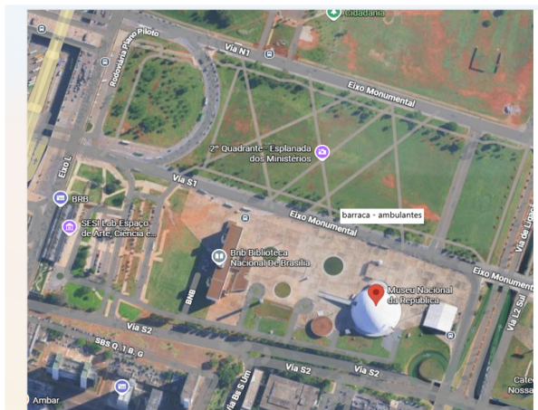
Evento Favela Sounds, 15 barracas – local: 2º quadrante da Esplanada, em frente ao Museu Nacional da República.

13.1. Não haverá reserva de vagas no chamamento público para as associações representativas da categoria dos Ambulantes.