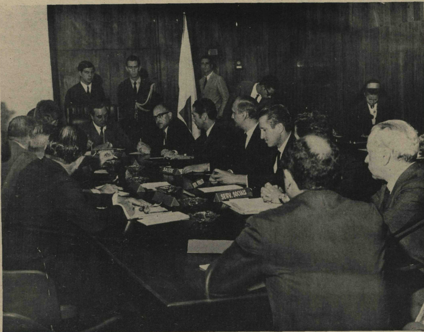
Aspecto da reunião do Secretariado do Governo do DF

A educação no Governo Prates da Silveira integrou as prioridades para o ano de 1970: dois bilhões de cruzeiros velhos serão destinados à construção imediata de escolas de emergência, para fazer face à crescente demanda de vagas no Distrito Federal. Esse foi um dos itens abordados - na área de educação - durante a primeira reunião do Governador do DF com seu secretariado.