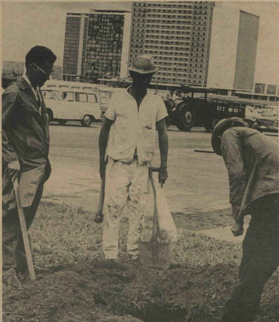
PLANTIO DE ARVORES - Numerosos trabalhadores da Divisão de Parques e Jardins do Departamento de Viação e Obras da Novacap, continuam em atividade no plantio de árvores, na poda dos gramados e nos cuidados das plantas ornamentais que enfeitam a cidade. O plantio, como os demais serviços, é orientado por técnicos especializados.

O roteiro dos Senadores inclui além do Brasil: Venezuela, Guiana, Argentina, Chile, Peru e Panamá.