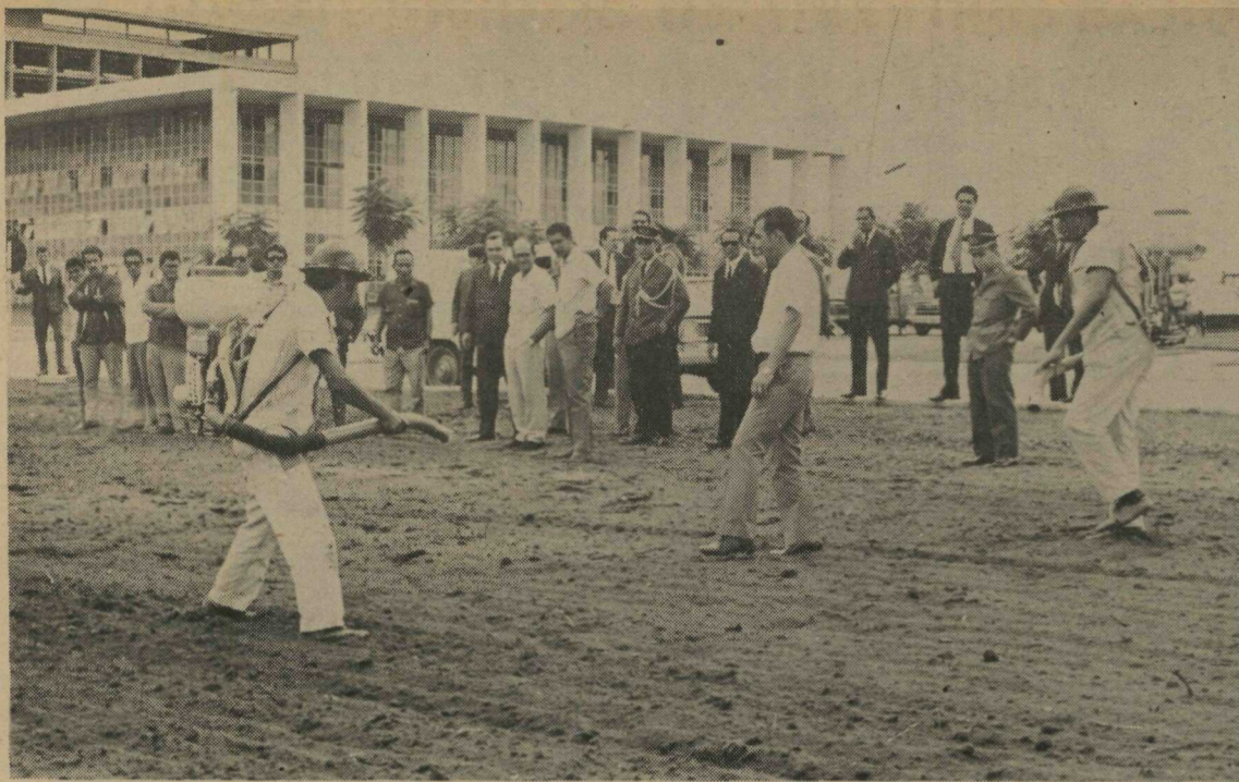
PLANTIO DE GRAMA - A NOVACAP - está adotando um novo tipo de plantio de grama, mais rápido e econômico. Trata-se do processo de hidro-semeadeira, em que as sementes de grama, misturadas a água e cola, são espalhadas nos locais preparados para seu recebimento. O processo está sendo usado na Asa Norte e no Eixo Monumental, nas imediações do Palácio do Buriti, tendo o Governador Hélio Prates da Silveira, acompanhado de Assessores, comparecido ao local (foto), assistindo à implantação das primeiras sementes