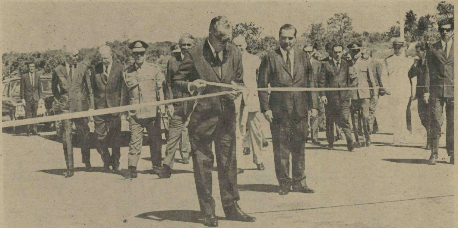
O Presidente Emílio Médici, acompanhado pelo Governador Hélio Prates da Silveira, desata a fita, dando por inaugurada a Rodovia BR-251. Ao ato compareceram Ministros do Estado, Secretários de Estado do GDF, Assessores e altas autoridades

A rodovia tem características modernas. Ao longo de seu leito o DER mandou colocar calhas e meios-fios e trechos gramados para evitar os efeitos da erosão pluvial. Possui moderna sinalização, foi executada em 15 meses de trabalho e seu custo total foi de seis milhões e 300 mil cruzeiros.