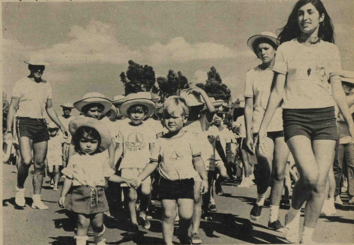
ACERTANDO O PASSO PARA O FUTURO - Na Colônia de Férias, promoção das Forças Armadas, os colonos passam dias inesquecíveis, aprendendo e divertindo-se. Entregues a instrutores capacitados, as crianças começam a aprender o alto significado dos símbolos pátrios e a conhecer os grandes vultos da nacionalidade. E vão, assim, acertando o passo para o futuro grandioso que espera o Brasil

Concluiu revelando que a SUDENE agora está estudando a possibilidade de implantação da metalurgia do tungstênio no Nordeste, para que a região possa melhor usufruir dessa riqueza mineral de seu subsolo.