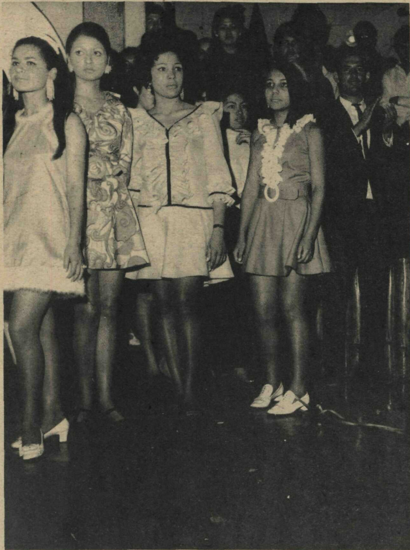
O Grêmio Esportivo Brasiliense, vem realizando interessante concurso para escolha da Garota Grêmio 68. Na foto algumas das concorrentes ao título quando desfilavam frente ao Juri.